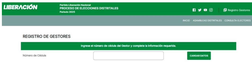
Ilustración 3: Validación del número de cédula del Gestor

En el formulario que se presenta a continuación se debe digitar el número de cédula del gestor tal y como este se presenta en el documento mismo (9 dígitos sin guiones):