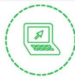
Sistema de inscripción de gestores, formularios y papeletas

Al sistema se accede por medio del sitio web: http://www.plndigital.net .