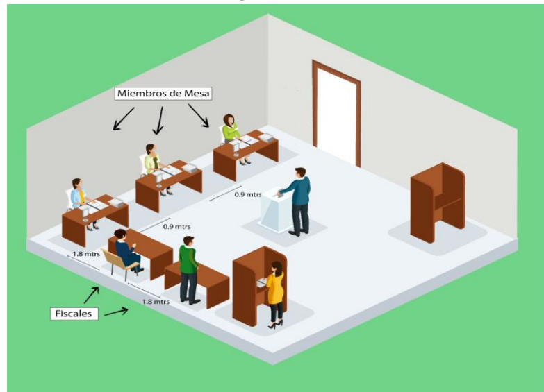
Distribución de una junta receptora de votos